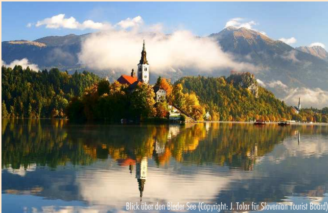
Blick über den Bleder See

Reiseziele: ÄGYPTEN - ÄTHIOPIEN - ALBANIEN - ARMENIEN - ASERBAIDSCHE - BALTIKUM - BELGIEN - BULGARIEN - CHILE - CHINA - FRANKREICH - GEORGIEN - GRIECHENLAND - GROSSBRITANNIEN - IRLAND - ISRAEL - ITALIEN - JORDANIEN - KROATIEN - LIBANON - MALTA - MAROKKO - MEXIKO - OMAN - ÖSTERREICH - PORTUGAL - POLEN - RUMÄNIEN - SCHOTTLAND - SKANDINAVIEN - SLOWAKEI - SARDINIEN - SCHWEIZ - SPANIEN - SÜDAFRIKA - RUSSLAND - TANSANIA - TSCHECHIEN - TUNESIEN - TÜRKEI - UNGARN - UKRAINE - USBEKISTAN - USA - ZYPERN - KREUZFAHRTEN u. v. m.