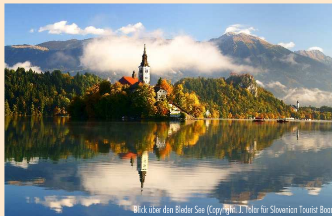
Blick über den Bleder See

Reiseziele: ÄGYPTEN - ÄTHIOPIEN - ALBANIEN - ARMENIEN - ASERBAIDSCHE - BALTIKUM - BELGIEN - BULGARIEN - CHILE - CHINA - FRANKREICH - GEORGIEN - GRIECHENLAND - GROSSBRITANNIEN - IRLAND - ISRAEL - ITALIEN - JORDANIEN - KROATIEN - LIBANON - MALTA - MAROKKO - MEXIKO - OMAN - ÖSTERREICH - PORTUGAL - POLEN - RUMÄNIEN - SCHOTTLAND - SKANDINAVIEN - SLOWAKEI - SARDINIEN - SCHWEIZ - SPANIEN - SÜDAFRIKA - RUSSLAND - TANSANIA - TSCHECHIEN - TUNESIEN - TÜRKEI - UNGARN - UKRAINE - USBEKISTAN - USA - ZYPERN - KREUZFAHRTEN u. v. m.