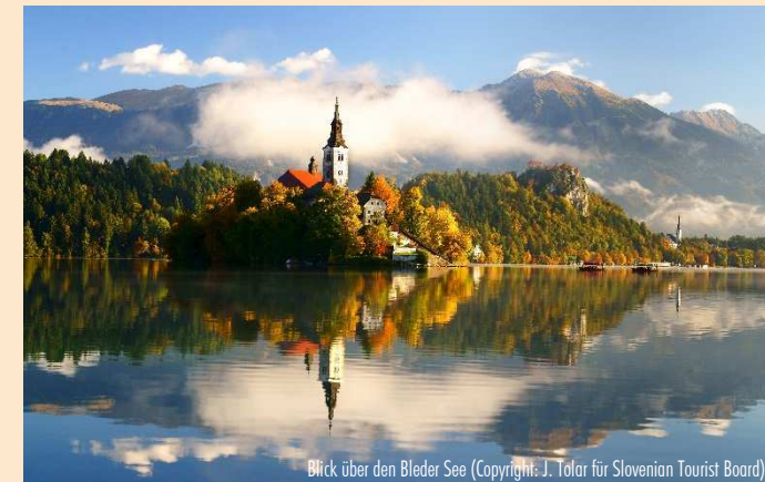
Blick über den Bleder See

Reiseziele: ÄGYPTEN - ÄTHIOPIEN - ALBANIEN - ARMENIEN - ASERBAIDSCHE - BALTIKUM - BELGIEN - BULGARIEN - CHILE - CHINA - FRANKREICH - GEORGIEN - GRIECHENLAND - GROSSBRITANNIEN - IRLAND - ISRAEL - ITALIEN - JORDANIEN - KROATIEN - LIBANON - MALTA - MAROKKO - MEXIKO - OMAN - ÖSTERREICH - PORTUGAL - POLEN - RUMÄNIEN - SCHOTTLAND - SKANDINAVIEN - SLOWAKEI - SARDINIEN - SCHWEIZ - SPANIEN - SÜDAFRIKA - RUSSLAND - TANSANIA - TSCHECHIEN - TUNESIEN - TÜRKEI - UNGARN - UKRAINE - USBEKISTAN - USA - ZYPERN - KREUZFAHRTEN u. v. m.